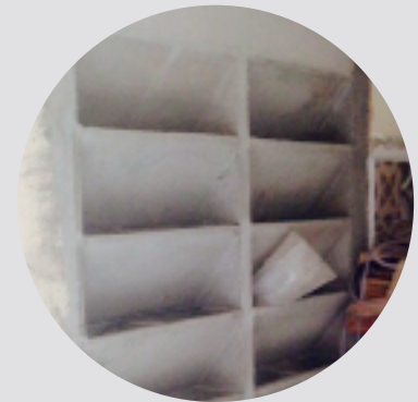
ECOBLOCO SM03 (7 blocos/m 2 )

3 MATERIAIS: A instalação deve ser feita com argamassa ACII (interno) ou ACIII (externo)