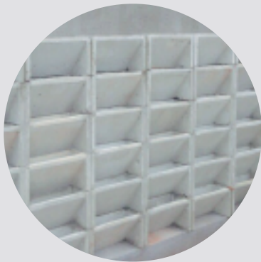
ECOBLOCO SM01 (12,5 blocos/m 2 )

2 INSTALAÇÃO: Após a secagem completa (pelo menos 2 horas), pode-se iniciar a montagem dos blocos, segundo as referências abaixo: