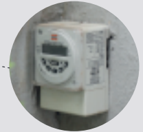
AUTOMÁTICO OU REGISTRO