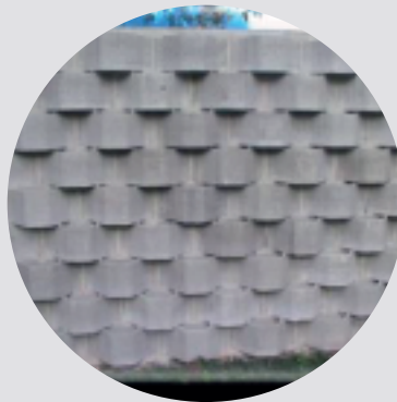
ECOBLOCO SM02 (12,5 blocos/m 2 )